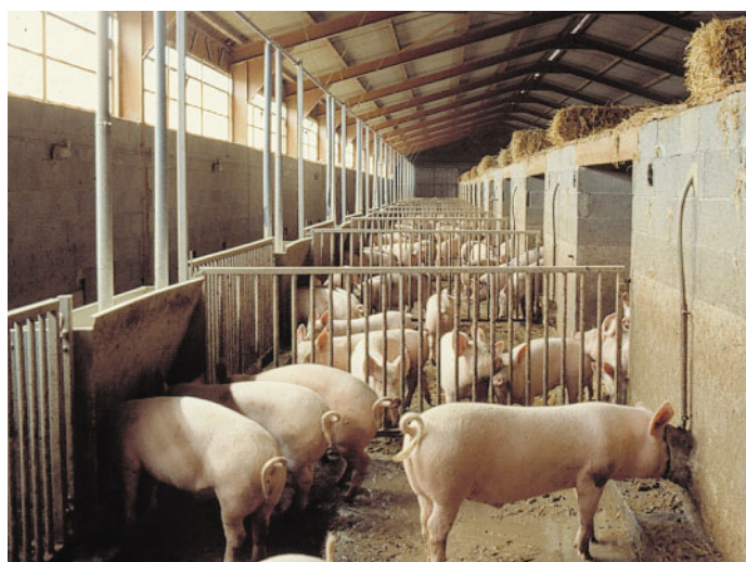
Bâtiment de type « camborough »

Malheureusement, il est difficile de produire une qualité sensorielle supérieure en viande fraîche avec les mêmes génotypes et des conditions d'élevage très proches de la production standard. A terme, la non-supériorité des porcs label rouge est une menace sérieuse pour cette filière. Cette attente de résultat par le consommateur explique probablement la faiblesse des parts de marché de ces produits en viande fraîche.